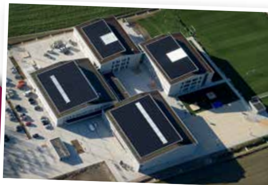
Vogelperspektive auf unsere Schule

Weitere Informationen dazu finden Sie auch auf der Homepage: www.schmuttertal-gymnasium.de